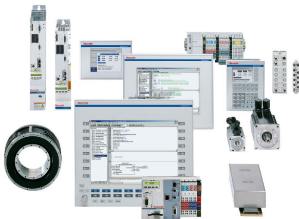
Gestion de robots et d'axes synchronisés avec IndraMotion for Packaging