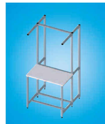
Extension du poste de travail – Augmentez votre flexibilité à l'aide de fonctionnalités supplémentaires