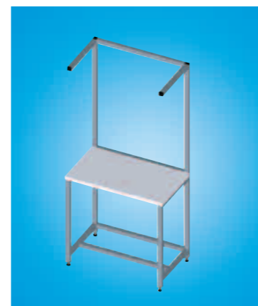
Postes de travail sur mesure – Réduisez ainsi l'espace réservé à la production