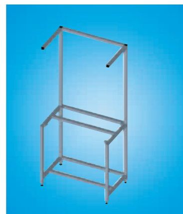
Piètements de table aux dimensions variables – Vous ne payez que les longueurs de profilés dont vous avez besoin

Un poste de travail parfaitement équipé, ergonomique et peu encombrant est la condition optimale pour produire plus efficacement. Les postes de travail non modulaires répondent rarement à ces exigences car vos conditions de production ne sont pas prises en compte. Les postes de travail de Rexroth : des postes individuels sur mesure.