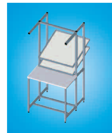
Mise à disposition des pièces à l'aide de niveaux de matériaux – Optimisez vos process en séparant le montage de la logistique