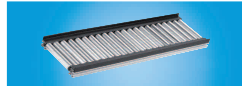
Voie de convoyage EcoFlow

Les rouleaux continus de largeurs variables sont caractéristiques d'EcoFlow. Ce système est donc la solution idéale pour les charges et palettes porte-pièces lourdes et pour le transport de matériaux dans, p. ex., des blisters, paniers de lavage et cartons.