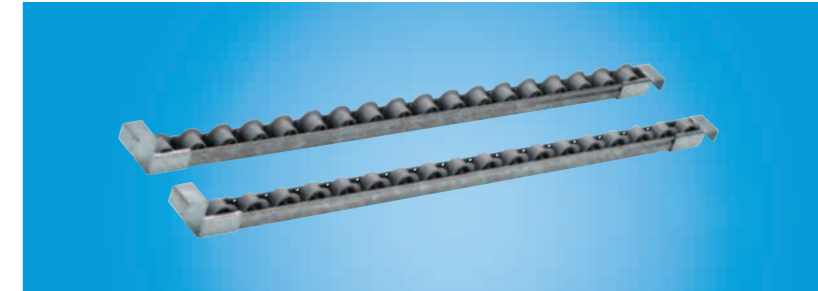
Economic – Voie de convoyage XLean

Le système de rayonnage XLean est composé d'un profilé en acier et de rouleaux avec ou sans joue de guidage. Optez pour XLean si vous recherchez un système de rayonnage économique.