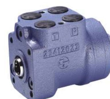
Agregat skrętu LAGC