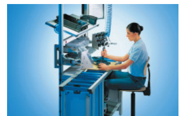
Check-list da Ergonomia

Bosch Rexroth Ltda. Av. Tégula, 888 12952-820 Atibaia SP Brasil Tel.: +55 11 4414.5723 Fax: +55 11 4414.5713 e-mail: assembly@boschrexroth.com.br site: www.boschrexroth.com.br