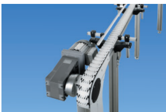
Transportador de Correntes Varioflow