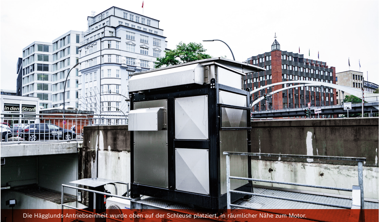
Die Hägglunds-Antriebseinheit wurde oben auf der Schleuse platziert, in räumlicher Nähe zum Motor.