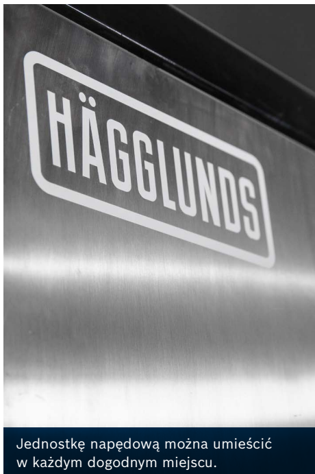
Jednostkę napędową można umieścić w każdym dogodnym miejscu.