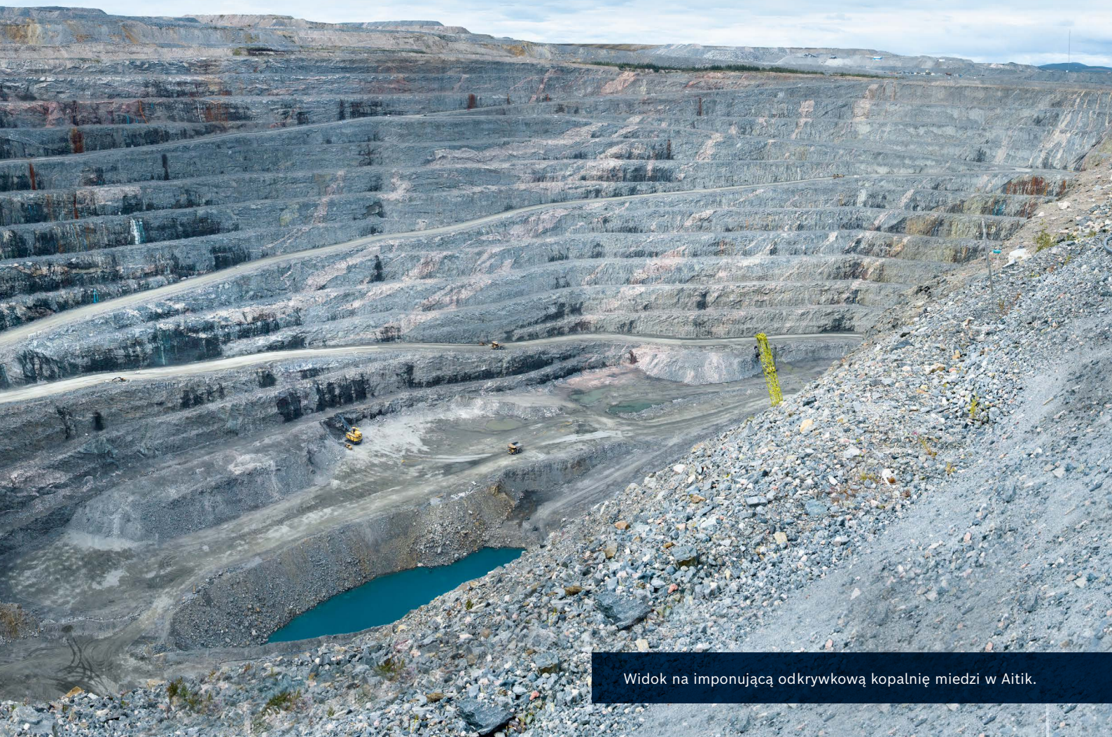
Widok na imponującą odkrywkową kopalnię miedzi w Aitik.